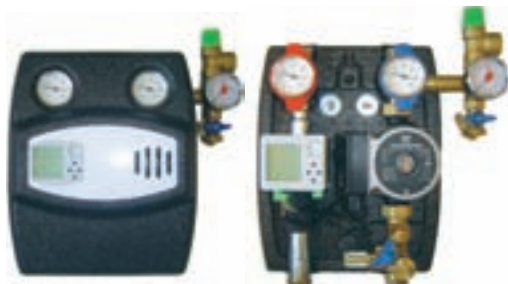
Systempaketet Villa extra.

Med Effectas nya systempaket ger vi dig fler möjligheter att styra din solanläggning optimalt. Grundversionen har en mängd olika programmöjligheter för att passa just dig. Att den t.ex. justerar pumpens hastighet efter solinstrålning gör att du i största möjliga mån får samma temperatur till din tank, vilket medför ökat energiutbyte på din solfångare.